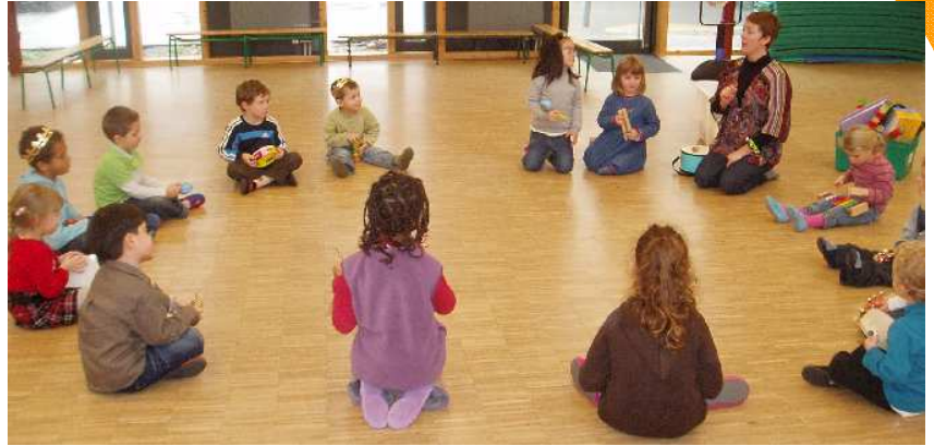
Eveil musical proposé aux enfants, en temps périscolaire (après le repas), une fois par semaine. Accueil de loisirs Le Pays Imaginaire - Morshwiller-la-bas

✓ Il favorise également la prononciation et la diction grâce notamment aux onomatopées (oups/splach...). L'écoute d'un disque ne peut pas avoir le même impact que les chansons que nous transmettons à un enfant.